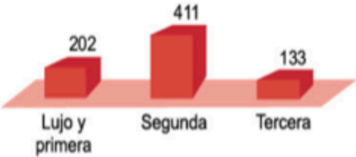
Distribución por categorías